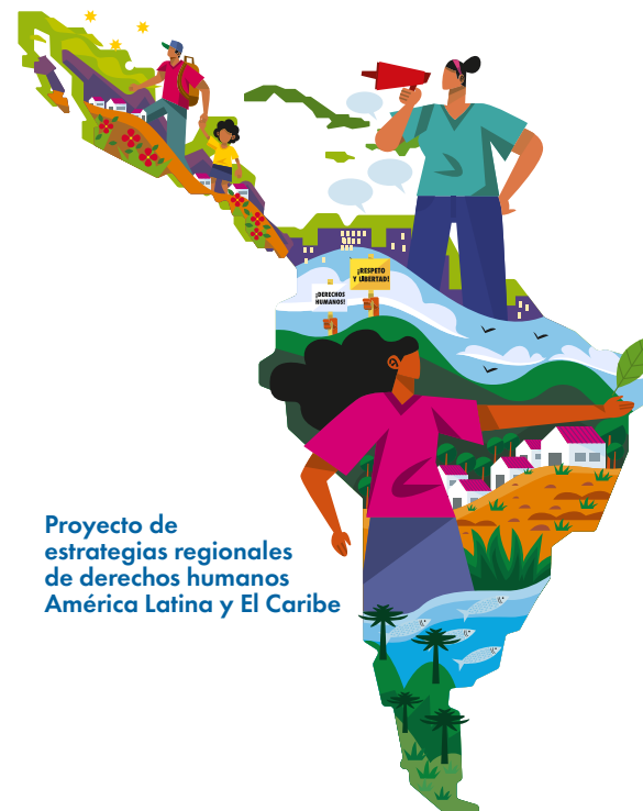
Proyecto de estrategias regionales de derechos humanos América Latina y El Caribe

A través de estas intervenciones, el proyecto espera lograr un entorno más seguro y habilitante para las personas defensoras de derechos humanos y periodistas, una mayor conformidad con las normas internacionales de derechos humanos en la gobernanza migratoria, y una integración efectiva de los derechos humanos en las políticas y acciones ambientales en la región.